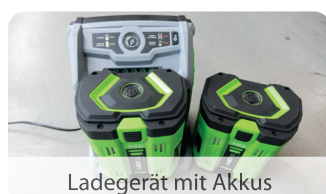
Ladegerät mit Akku